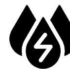
Water, sanitair en elektriciteit