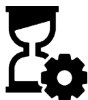
Project in uitvoering